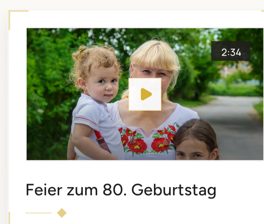
Feier zum 80. Geburtstag